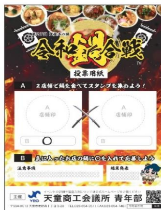
応募ハガキ(スタンプ台紙)_ウラ