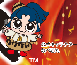
公式キャラクター なべがssen