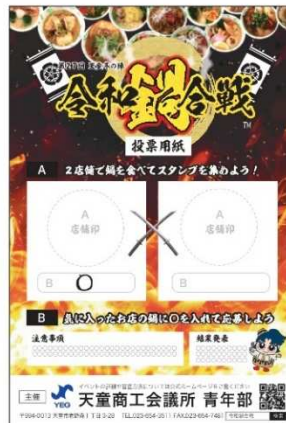
応募ハガキ(スタンプ台紙)_ウラ